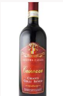
ダヴィッディ - キャンティ コッリセネージ Azienda Casale Daviddi- Chianti Colli Senesi <Italy>