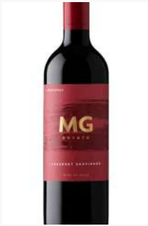
MG エステート - カベルネ・ソーヴィニヨン MontGras MGEstate - Cabernet Sauvignon <Chile>