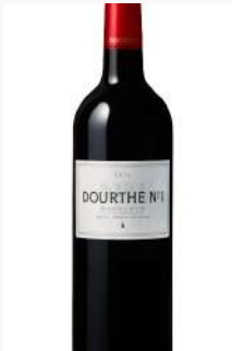
ドゥルト - ヌメロ・アンルージュ Dourthe - No.1 <France>