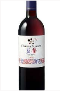
シャトー・メルシャン - 藍茜 (あいあかね) Chateau Mercian - Ai akane <Japan>