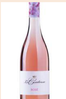
レ・コンテッセ - ピノ ロゼ フリッツァンテ (微発泡)